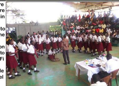
Progetto ospitalità e Social Hall

L'Ostello IKSDP di Niandiwa è in grado di ospitare singole persone, famiglie e gruppi: tutte le camere sono sobrie e comode e i pasti vengono serviti in un ampio salone-mensa. Il Centro ha una grande Social Hall, ideale punto d'incontro per meeting e conferenze, ma anche per matrimoni e spettacoli della comunità. L'anfiteatro può ospitare circa 500 persone, con aule più piccole per i seminari: è dotato di impianto di amplificazione, computer e connessione WiFi a banda larga. Tutte le strutture e i servizi contribuiscono, con le altre attività, ad autofinanziare i progetti del Centro IKSDP.