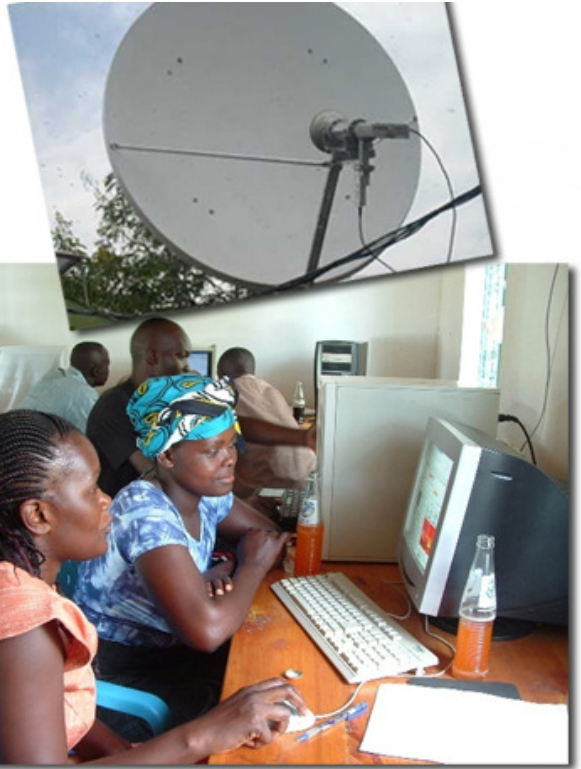
L'Internet Service Point di Nyandiwa attira molte persone ogni giorno, dai villaggi vicini