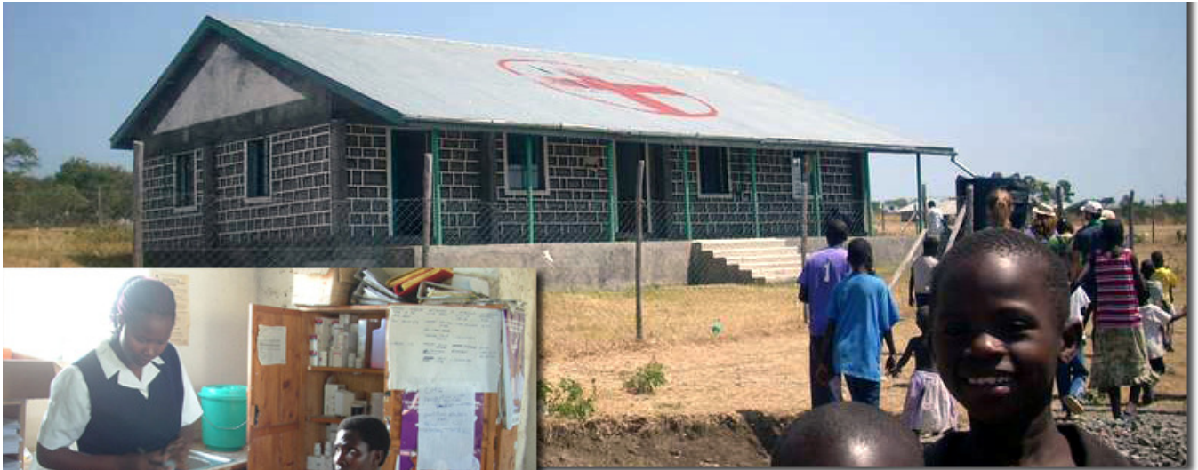
I dispensari medici di Kiwa (nella foto) e di Kisaku sono stati costruiti nell'ambito del progetto Harambee Gwassi e vengono autogestiti dalle comunità locali.